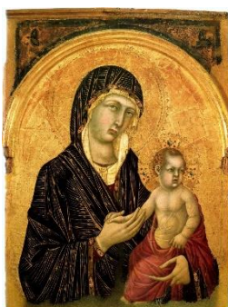
Madonna col Bambino (Simone Martini)

La Madonna col Bambino è un dipinto a tempera e oro su tavola di Simone Martini , databile al 1305-1310 circa e conservata nella Pinacoteca Nazionale di Siena .